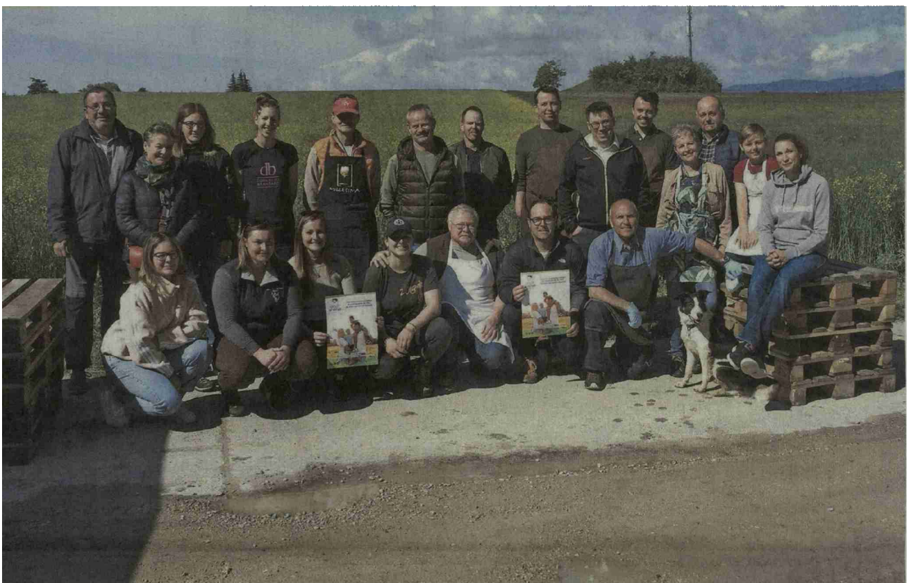
Initiateurs et bénévoles actifs lors de l'inauguration du Circuit du Paysan samedi dernier à Denens. Schwarb